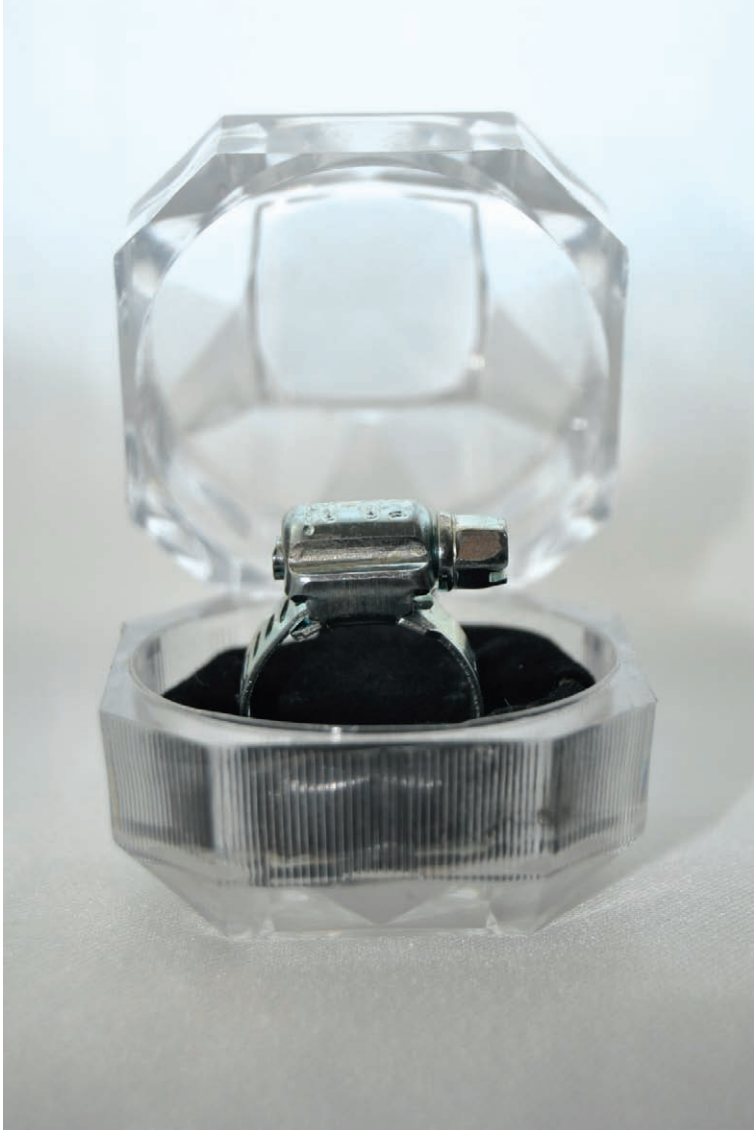
“Gustîlka Kelepçeyî” 4.5x4.5x6.5 cm Bicîkirin, 2010