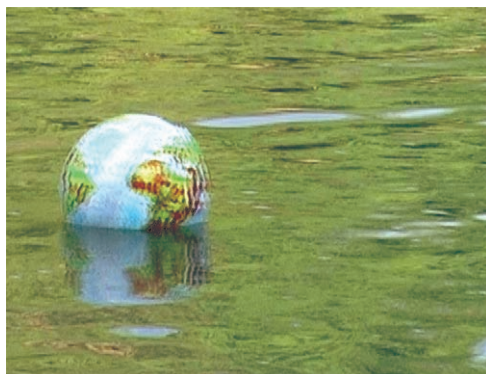
“Lîstikvanê تنها” 02”48 Video, 2010