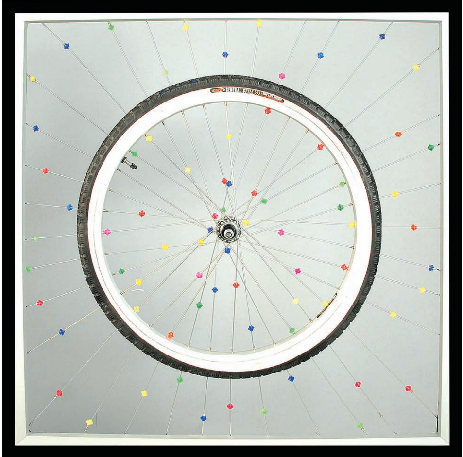
"Bênâv" 100x100 cm Bıçkırın, 2010 "İsimsiz" 100x100 cm Yerleştirme, 2010 "Untitled" 100x100 cm Installation, 2010