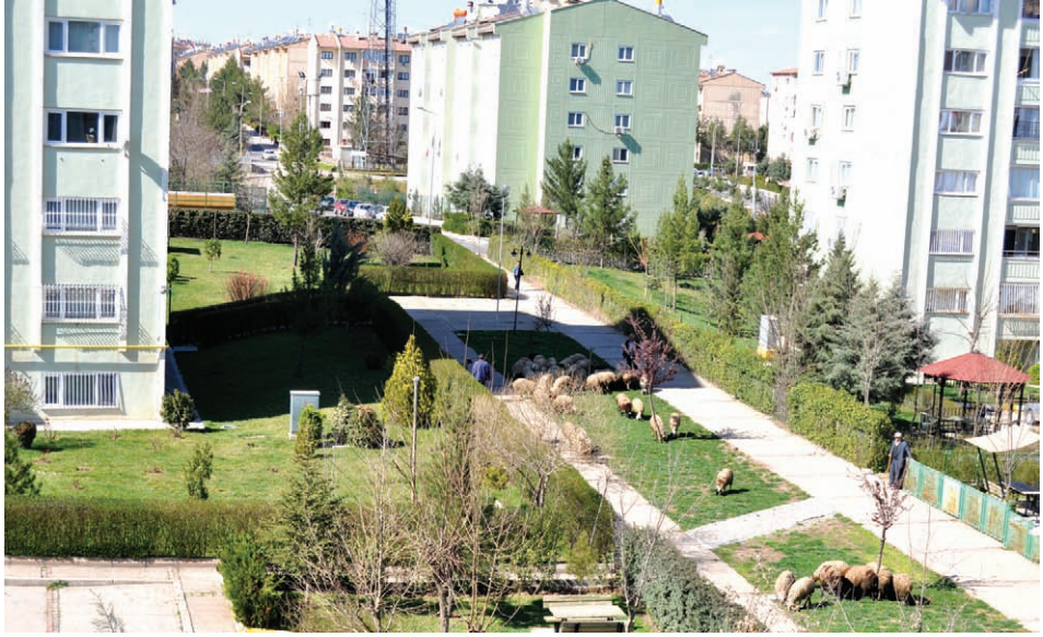
“Set 1” 80x50 cm Çapa Dîjital, 2013 “Set 1” 80x50 cm Dijital Baskı, 2013 “Set 1” 80x50 cm Digital Pint, 2013