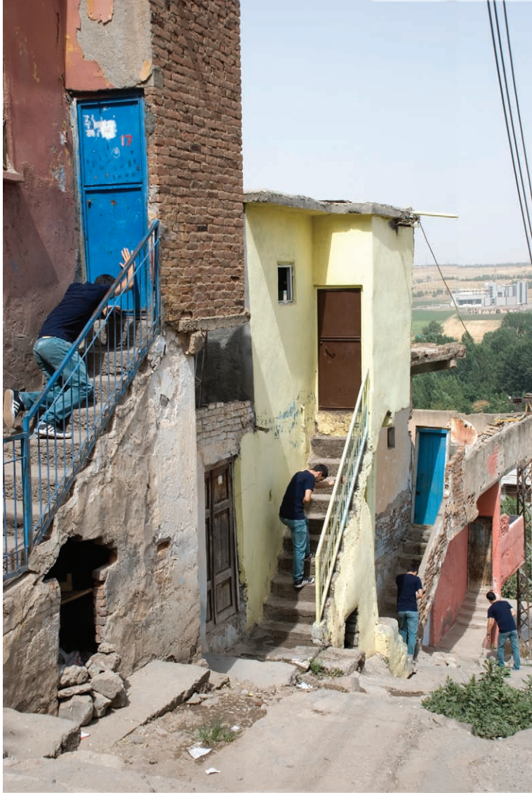
“Gencek Hildiperike Pêlikan” 100x75 cm, Çapa Dijîtal, 2011 “Merdivenden Çıkan Genç” 100x75 cm, Dijital Baskı, 2011 “The Young Going Up The Stairs” 100x75 cm, Digital Print, 2011