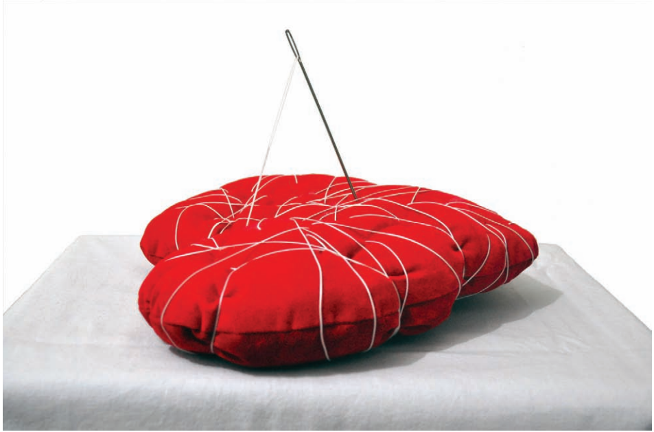
"Bênay" 25x25x10 cm Bıçkırın, 2012 "İsimsiz" 25x25x10 cm Yerleştirme, 2012 "Untitled" 25x25x10 cm Installation, 2012